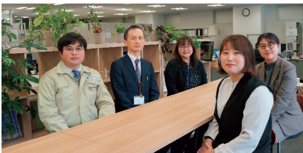
業務管理課 メンバー

また、大阪事務所に拠点を置く、製品認証センター、構造判定センター、建築確認評定センターの共通事務業務として、大阪事務所設備の管理、共通備品の購入、現金出納の管理も行っています。2024年4月からは、3センターの請求事務を業務管理課に統括し、業務の効率化を図ります。