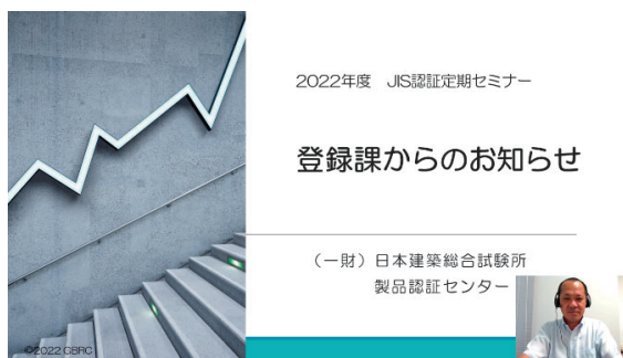
テーマ2 登録課からのお知らせ