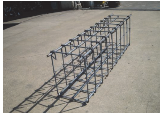
写真-2 現場組立 鉄筋スポット先組工法ユニット