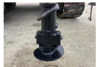
写真2 専用ヘッド (先端ピース取付け時)