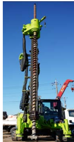
写真1 使用機材の一例

申込者が提案する「W-ZERO 工法 設計・製造・施工基準」に従って施工された補強地盤の長期許容支持力度を定める際に必要な地盤で決まる極限支持力度は、同基準に定めるスクリーウエイト貫入試験結果に基づく支持力度算定式で適切に評価できる。