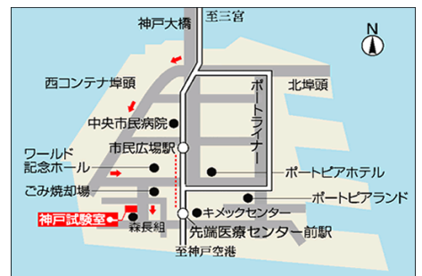
(財) 日本建築総合試験所 神戸試験室

JR・阪急・阪神三宮駅より ポートライナーで先端医療センター前駅 下車・徒歩約8分