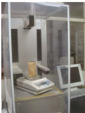
写真2 供試体の寸法・質量自動測定装置

品質管理や保証に対する意識が高まるにつれて、改良土の一軸圧縮試験の需要は年々増加しています。当試験室では、試験の効率化とヒューマンエラーの排除を意図して、供試体の受け入れから報告書発行までを高度に自動化した装置(写真2など)とデータベースを開発し運用しています。