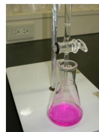
Rc の測定 (中和滴定法)