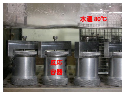
写真2 恒温水槽内の反応容器