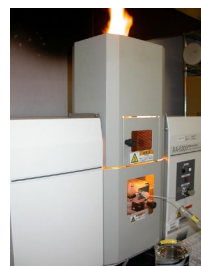
Sc の測定 (原子吸光度法)

「無害でない」とは、潜在的に反応性を持つと考えられる骨材ですが、JIS A 5308 では抑制対策を実施すればコンクリートに使用できます。また、化学法で「無害でない」と判定された骨材でも、モルタルバ一法の試験結果が「無害」と判定された場合は、その骨材は「無害」と判定されます。