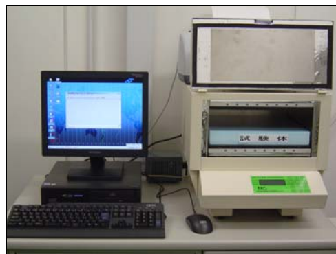
熱伝導率試験の状況 (JIS A 1412-2)