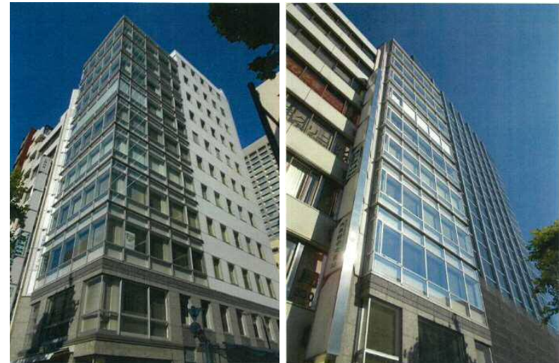
西新橋一丁目川手ビル外観