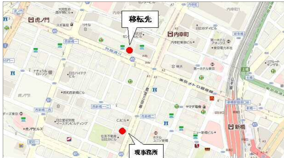
GBRC東京事務所周辺地図