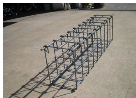
写真-2 現場組み立て 鉄筋スポット先組工法ユニット