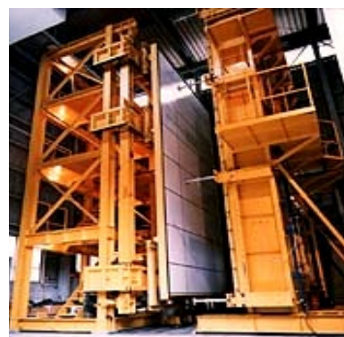
大型圧力箱とのドッキング状況