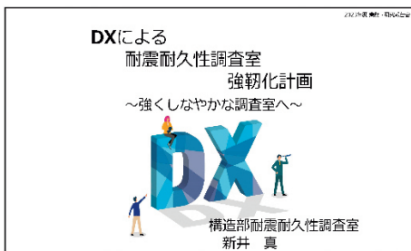
写真-1 オンデマンド配信動画の一例