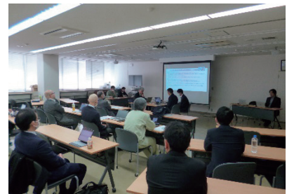
写真-3 ライブ配信発表会場の様子